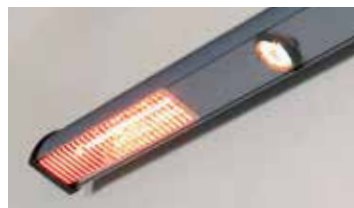
Belysning och värme